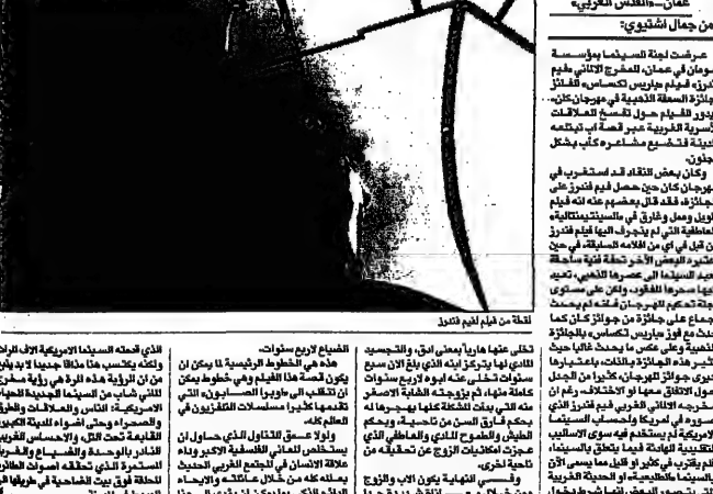
عنان - القدس العربي - من جمال تشويكي